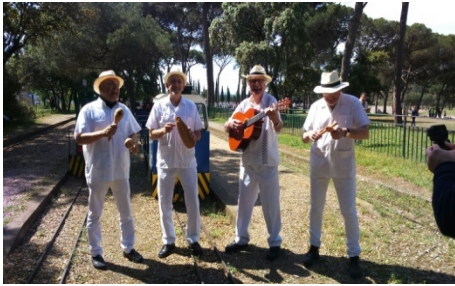
Els del Son de la Rambla ens varen fer un petit concert als socis i els visitants

Ens ha visitat una part del grup de música SON DE LA RAMBLA que es dedica a la música tradicional cubana a Barcelona. El motiu de la visita és la gravació i edició d'un vídeo per promocionar una nova cançó.