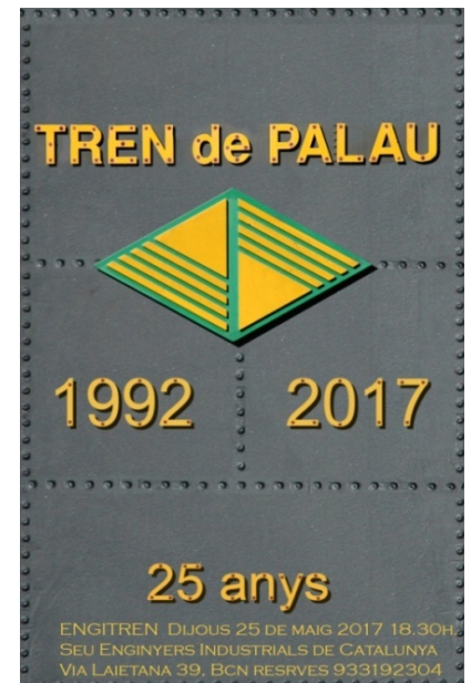
Cartell de la presentació.

Seguidament en Ricard Soler va presentar les diferents fases de la construcció de la nostra locomotora A2, ara ja en la seva fase final.