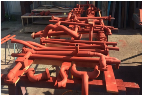
Procés de pintat dels tubs hidràulics

En pocs dies la podrem veure a l'aula on li farem la instal·lació elèctrica, i si podem ja la posarem en marxa tot fent un període de proves.