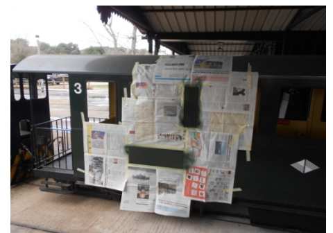
Procés de repintat.

No son pintades "artístiques", son ratlles fetes amb les pedres del balast. Després de repintar-les, es pot veure el tros amb un to de pintura diferent.