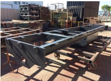
Pintura definitiva del bastidor