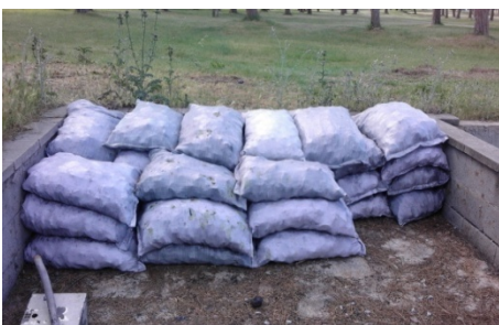
Fins i tot el transportista ens ha col·locat els sacs ben ordenats. Gràcies.

Un altra vegada hem comprat carbó d'hulla. Una tona més que es continuarà utilitzant per l'espectacle de força, vapor i fum. Molts dels nostres viatgers venen especialment per reviuere el vells temps del vapor veient un enginy que recrea èpoques de transport ja passades. Mes d'un viatger ens ha preguntat en quin lloc porta el motor de gasoil.