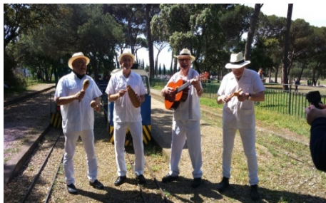
Els del Son de la Rambla ens varen fer un petit concert als socis i els visitants

Ens ha visitat una part del grup de música SON DE LA RAMBLA que es dedica a la música tradicional cubana a Barcelona. El motiu de la visita és la gravació i edició d'un vídeo per promocionar una nova cançó.