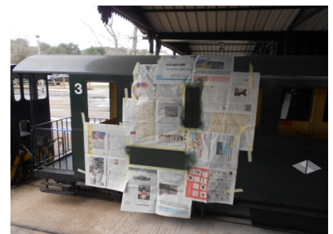
Procés de repintat.

No son pintades "artístiques", son ratlles fetes amb les pedres del balast. Després de repintar-les, es pot veure el tros amb un to de pintura diferent.