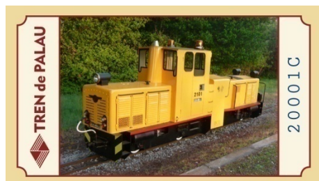
Alguns dels bitllets

Aquest ferrocarril és operat pels socis del Tren de Palau - Associació Cultural d'Amics del Ferrocarril.