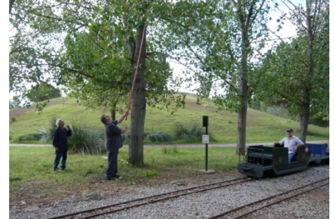
La brigada en acció.

Com cada entrada de curs, ens veiem obligats a tallar branques seques dels arbres que estan per sobre de la via i poden posar en perill trens i viatgers. A més hem de fer una repassada a les verdisses que després de les pluges d'agost han crescut força. En aquest cas la naturalesa és previsible.