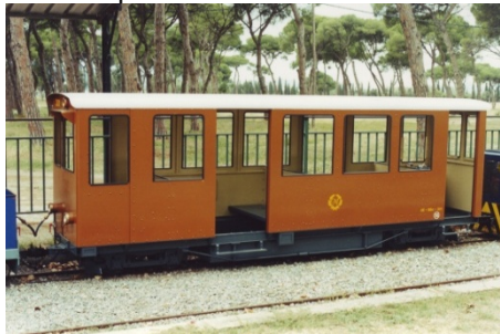
Una de les primeres imatges del tramvia que en fase de proves va remolcat.

El dia 7 de setembre del 2001 va arribar al les instal·lacions del Tren de Palau el tramvia AE-BBo-301. Aquest està inspirat a partir d'un automotor ABDm del Appenzeller Bahn. Porta uns bogies tipus Pennsylvania amb motors de corrent continu d'imans permanents amb una potència de 750 Watt a 24 v.