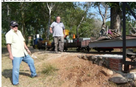
Mirada amb satisfacció del muret acabat.

Encara que amb discrepàncies dels enginyers, una mica recta sí que ha quedat, oi?.