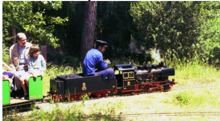
Circulant per l'Oreneta.

Aquesta imatge és del juny de 1988. Només fa 27 anys i 4 mesos.