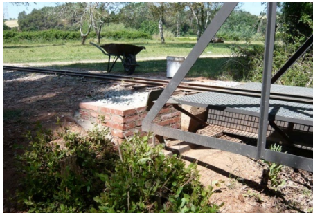
Una vista d'un dels murs del tercer pont que com tots recordeu és un autèntic pont Warren.

De totes maneres el mur farà la seva feina i a partir d'ara la terra ja no afectarà al pont.