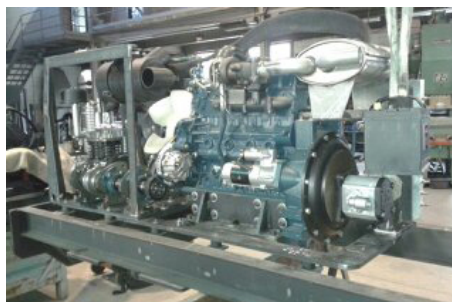
Vista del motor muntat amb el tub d'escapament i la bateria posicionada al seu lloc provisionalment.

Mentrestant s'acabarà de repassar el disseny de la hidràulica i esperem que aviat la podrem muntar.