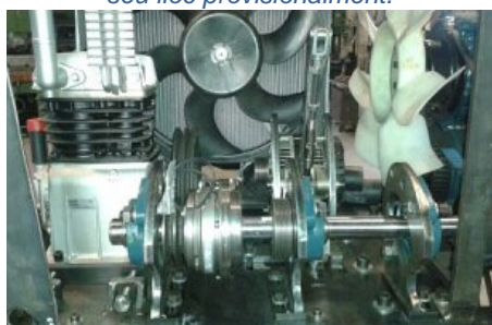
Vista de l'eix de força.